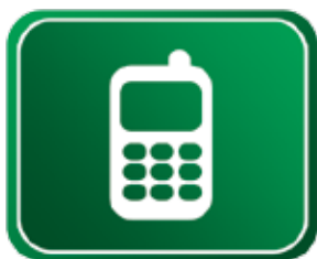
Locação de telefone celular