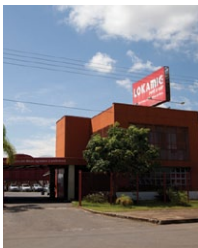
Estacionamento de Confins

A empresa possui, ainda, filiais nos aeroportos da Pampulha e de Confins, ambas com estacionamento próprio. Na Pampulha, o estacionamento fica próximo ao aeroporto, na avenida Magalhães Penido, número 100, em um terreno de 400m 2 para oferecer mais comodidade e segurança para todos os clientes.