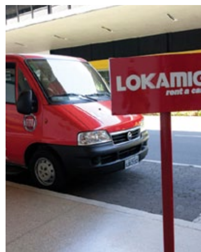
Van para transporte de clientes