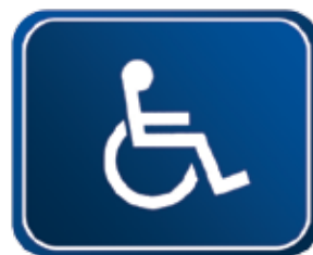
Veículos para portadores de necessidades especiais