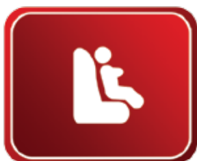
Locação de cadeirinha de bebês